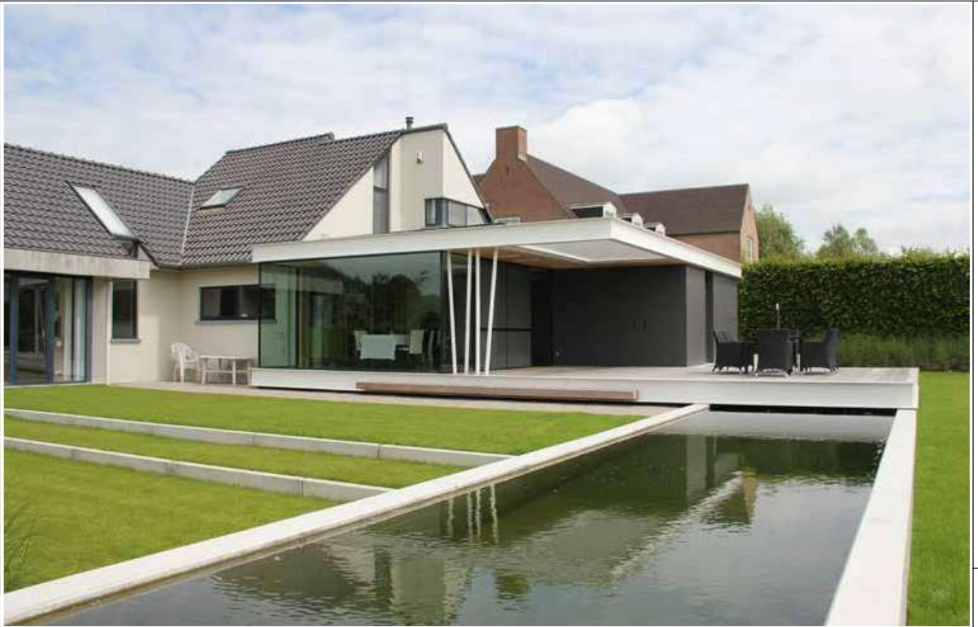
Woning in Kortrijk, Architecten Delobelle