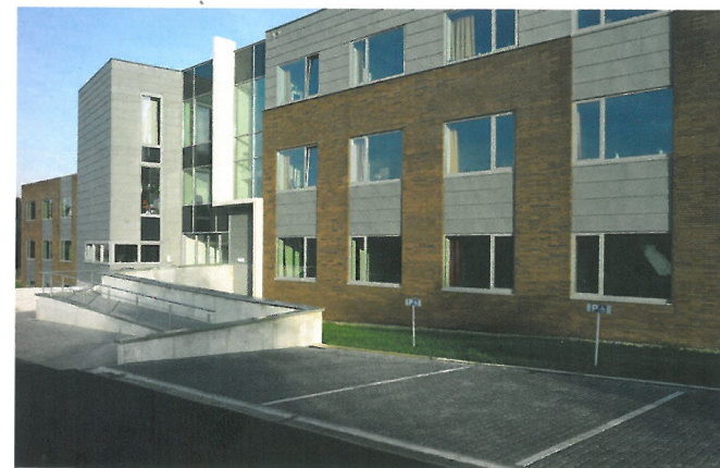
Les Comtes de Méan.