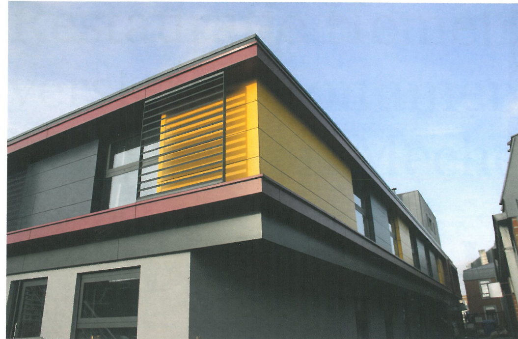
Les jardins de Scailmont.